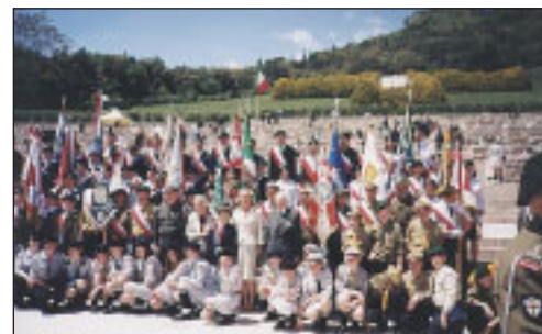
W uroczystościach na Cmentarzu uczestniczyły też – z pocztami sztandarowymi – liczne grupy harcerzy i uczniów. Szczególnie byli widoczni pełniący służbę harcerze, którzy uczestnikom uroczystości roznosili wodę

Złożenie wieńców przed Pomnikiem, wręczenie władzom miasta złotego pierścienia „Golgoty Wschodu” i urny z prochami żołnierzy włoskich z nekropolii kostrzyńskiej.