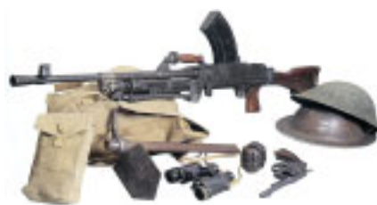
Na wystawie w Muzeum obejrzeć można było m.in. uzbrojenie polskich żołnierzy walczących o Monte Cassino. Na zdjęciu: ręczny karabin maszynowy Bren Mk I i rewolwer Smith Wesson