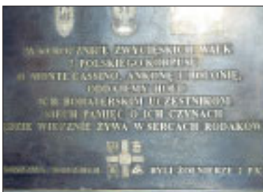
Podczas mszy św. Biskup Polowy WP poświęcił tablicę upamiętniającą uczestników walk o Monte Cassino, Ankonę i Bolonię. Ufundowali ją, z własnych składek, byli żołnierze 2 Korpusu Polskiego dla uczczenia pamięci swoich towarzyszy broni. Tablicę umieszczono w Katedrze Polowej Wojska Polskiego.