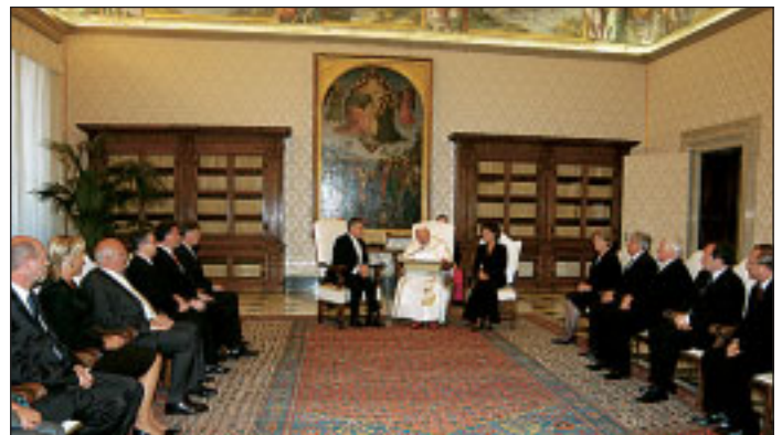
Prezydent Aleksander Kwaśniewski i Jolanta Kwaśniewska zostali przyjęci przez Jana Pawła II wraz z oficjalną delegacją na audiencji specjalnej.

Serdecznie Państwa witam. Nasze dzisiejsze spotkanie ma miejsce w szczególnych okolicznościach. Wiąże się ono bowiem z sześćdziesiątą rocznicą bitwy o Monte Cassino. Wszyscy Polacy z dumą wspominają tę walkę, która dzięki bohaterskiej postawie wojsk dowodzonych przez generała Andersa otworzyła aliantom drogę do wyzwolenia Włoch i pokonania nazistowskiego okupanta. Na tamtejszym cmentarzu wojennym