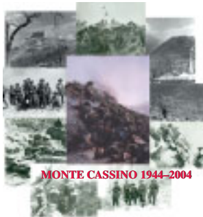
MONTE CASSINO 1944-2004