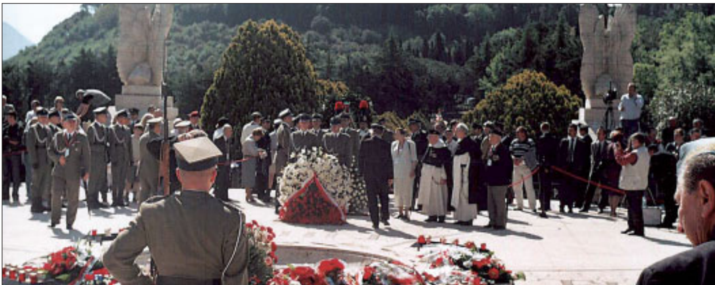
Centralne miejsce na Cmentarzu - pokryty kwiatami wizerunek Krzyża Virtuti Militari

M ódlmy się za oficerów i żołnierzy, poległych – w liczbie dwieście dwadzieścia cztery – w bitwie o Monte Cassino w maju 1944 roku: z Trzeciej Dywizji Strzelców Karpackich, Piątej Kresowej Dywizji Piechoty, Drugiej Pancерnej Brygady i innych jednostek, idących przez Sybir, Palestynę, „z ziemi włoskiej” do Polski, którzy oddali „Bogu ducha, ziemi włoskiej ciała, a serce Polsce”, aby Dawca życia wiecznego wynagrodził ich ofiarniczą śmierć oglądaniem Boga twarzą w twarz w Ojczyźnie niebieskiej.