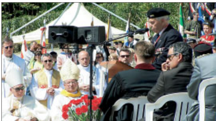
Kilka tysięcy osób zgromadzonych na Cmentarzu wysłuchało mszy św., a potem modlitw ekumenicznych

Monte Cassino załopotał biało-czerwony sztandar. (...) Do tego sanktuarium przez minionych sześćdziesiąt lat pielgrzymowały rzesze Polaków. Przybywał wielokrotnie do swoich żołnierzy, zanim sam wśród nich nie spoczął, generał Władysław Anders . Pielgrzymował tu Ojciec Święty Jan Paweł II . Pielgrzymowali Prezydenci Rzeczypospolitej. Jesteśmy tu dzisiaj, aby w imieniu wolnej Ojczyzny złożyć hołd poległym bohaterom. My, Polacy – może nawet bardziej niż inni – rozumiemy, że „wolność krzyżami się mierzy”. Jesteśmy wdzięczni i pamiętamy! Zawsze będziemy pamiętać!”