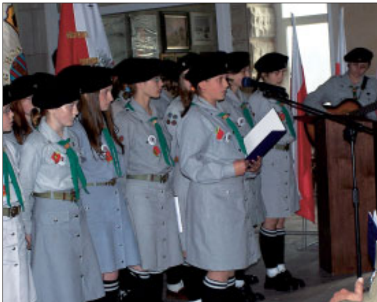
Występy zespołu harcerskiego przyjmowane były bardzo gorąco

Ostatnim akordem uroczystości centralnych było warszawskie spotkanie młodzieży uczącej się w szkołach kultywujących tradycję walk Polskich Sił Zbrojnych na Zachodzie, przede wszystkim walk 2 Korpusu Polskiego w kampanii włoskiej. Uczniowie przyjechali z całej Polski. Wystawili kilkadziesiąt pocztów sztandarowych, przygotowali specjalny program słowno-muzyczny, wielu z nich uczestniczyło w ogólnopolskim konkursie plastycznym i literackim, którego tematem była Bitwa. Pod kierunkiem swoich nauczycieli przygotowali się bardzo sumiennie. Kombatanci bio-