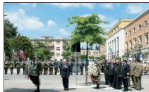
Uroczystości w mieście Cassino rozpoczęły się od złożenia wieńca przez prezydenta Ryszarda Kaczorowskiego