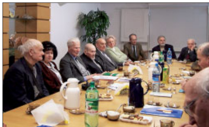
W każdy drugi poniedziałek miesiąca do gmachu Państwowego Instytutu Geologicznego w Warszawie przychodzi około dwudziestu osób