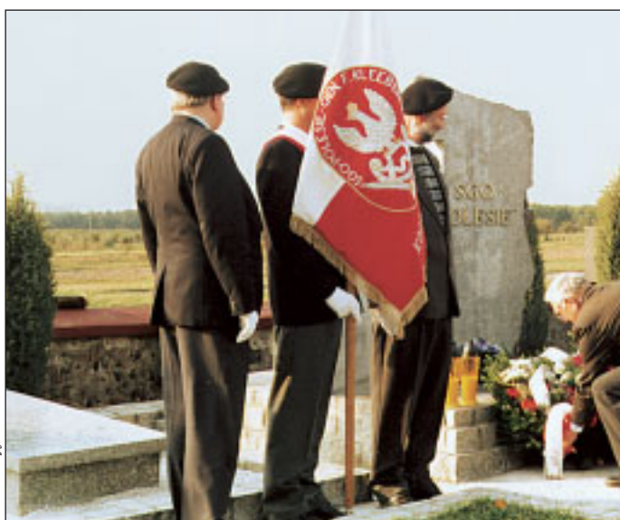
Poczet sztandarowy Środowiska Żołnierzy Samodzielnej Grupy Operacyjnej „Polesie”