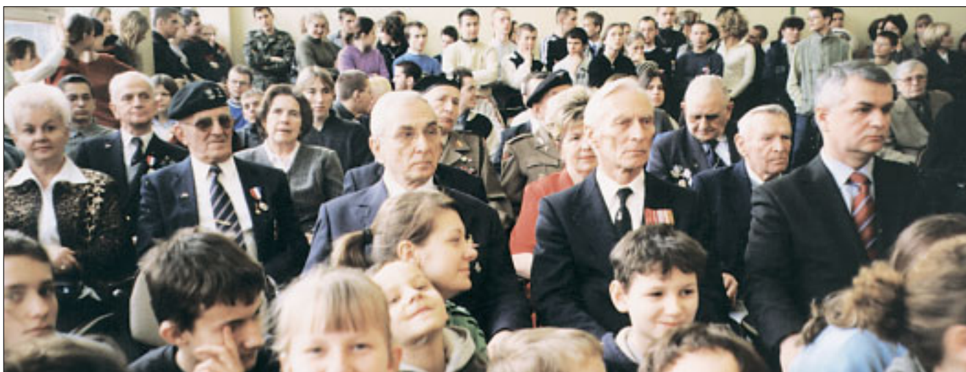
Uroczysta akademia poświęcona Generalowi Stanisławowi Maczkowi i Jego Żołnierzom