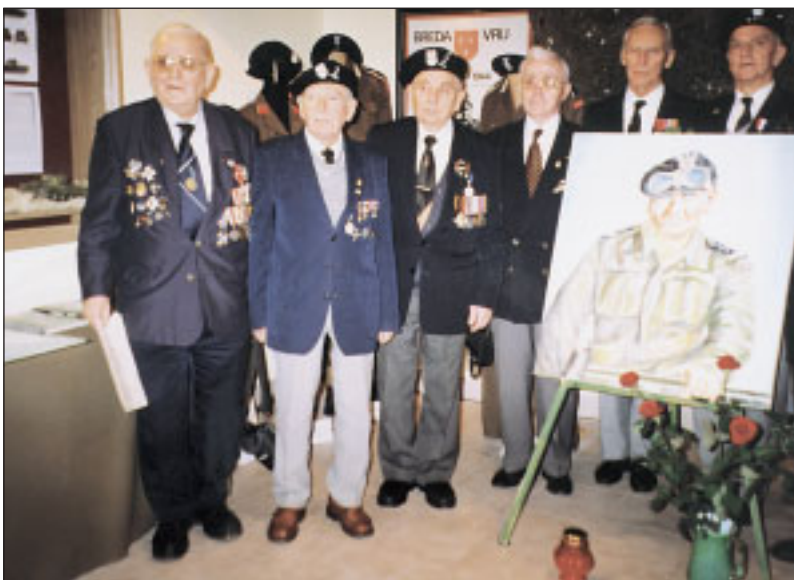
Kombatanci z 1 Dywizji Pancерnej podczas otwarcia sali tradycji

Siedem lat temu Ośrodek Szkolno-Wychowawczy dla Dzieci i Młodzieży Słabo Słyszającej i niesłyszącej w Bydgoszczy otrzymał imię gen. Stanisława Maczka. W rocznicę tego wydarzenia zorganizowano obchody „Dnia Patrona”.