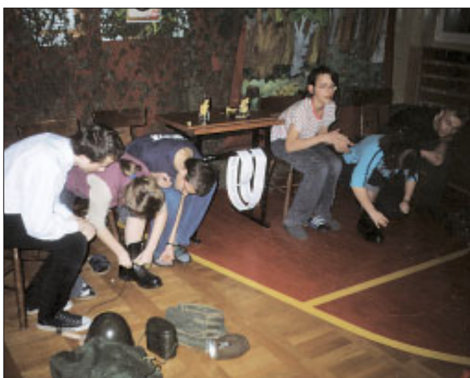
Występy uczniów, którzy odgrywają scenki z życia żołnierzy